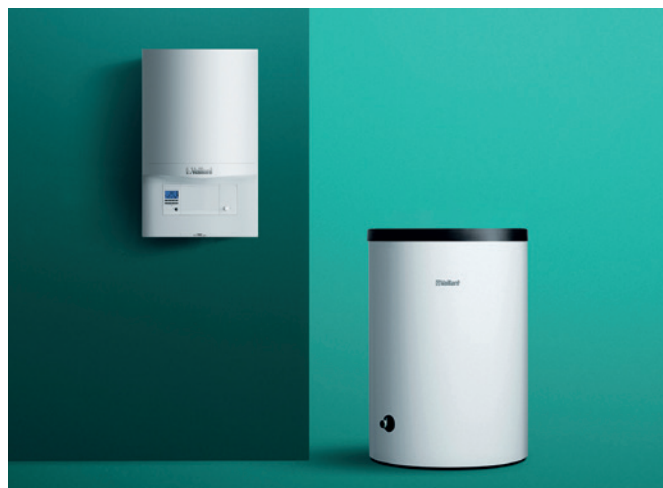
Kotol ecoTEC pro, zásobník uniSTOR VIH R 120 B