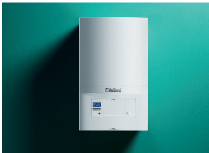
Závesný plynový kotol ecoTEC pro